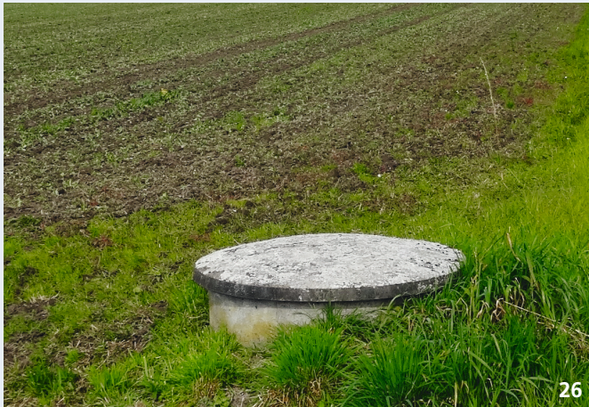
Der Schacht ist mit einem Deckel verschlossen. Der Schachtdeckel ist intakt und weist keine Löcher oder Risse auf.