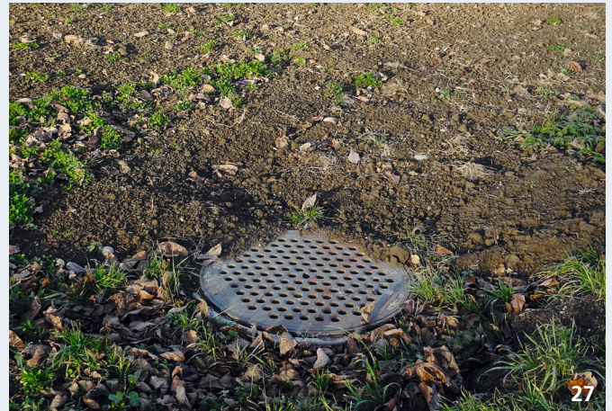
Der Schacht hat keinen oder einen undichten Deckel. Wasser aus dem Feld und erodierte Erde können in den Schacht gelangen.